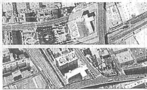
3. Planta de situación de la residencia.

La inversión de la obra y equipamiento de la residencia que realizará la UTE Alberca-Tejera ascenderá a 8.542.493,83 euros. La financiación correrá a cargo de la empresa, si bien la Universidad de Almería participará en la financiación de la obra con dos millones de euros, que serán abonados fraccionadamente a medida que se vayan emitiendo certificaciones de obra, proporcionalmente a la aporta-