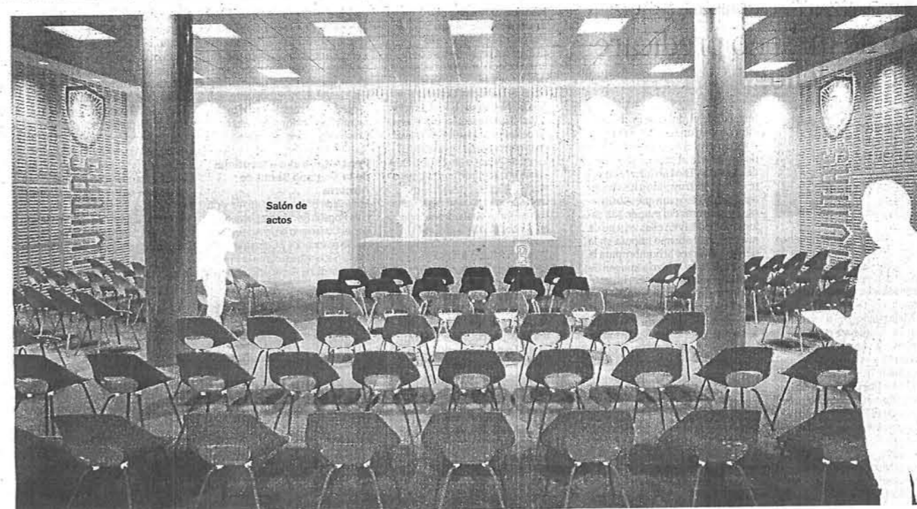
Salón de actos

que los 650 euros con pensión completa que costarán las habitaciones compartidas. Este precio situará a 'Civitas' como una de las residencias universitarias no sub-