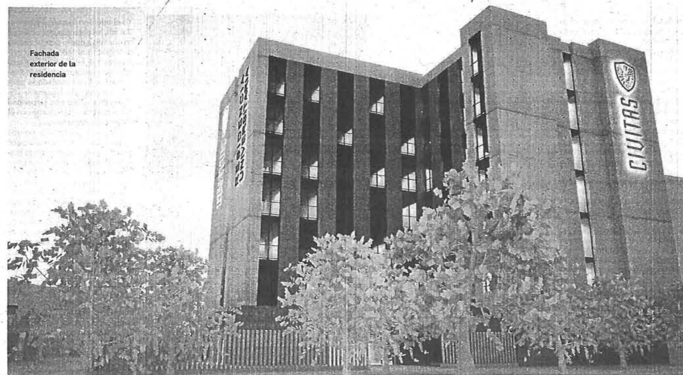
Fachada exterior de la residencia