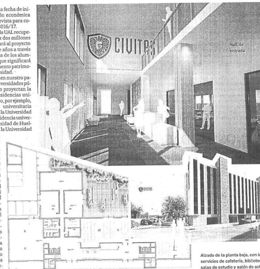
Alzado de la planta baja, con los servicios de cafetería, biblioteca, salas de estudio y salón de actos.

En la actualidad, en nuestro país también otras universidades públicas construyen o proyectan la construcción de residencias universitarias. Es el caso, por ejemplo, de la residencia universitaria 'Juan de la Cosa' de la Universidad de Cantabria; la residencia universitaria de la Universidad de Huelva; la residencia de la Universidad de Murcia o la residencia universitaria de la Universidad de Alcalá de Henares, en Madrid. De reciente construcción se encuentran también las residencias universitarias del Campus Montilivi de la Universidad de Gerona; la residencia La Ribera de la Universidad de Logroño; la residencia universitaria Apartamentos Campus de la Universidad de Lérida y la residencia 'Rector Estanislao del Campo' de la Universidad de Sevilla.